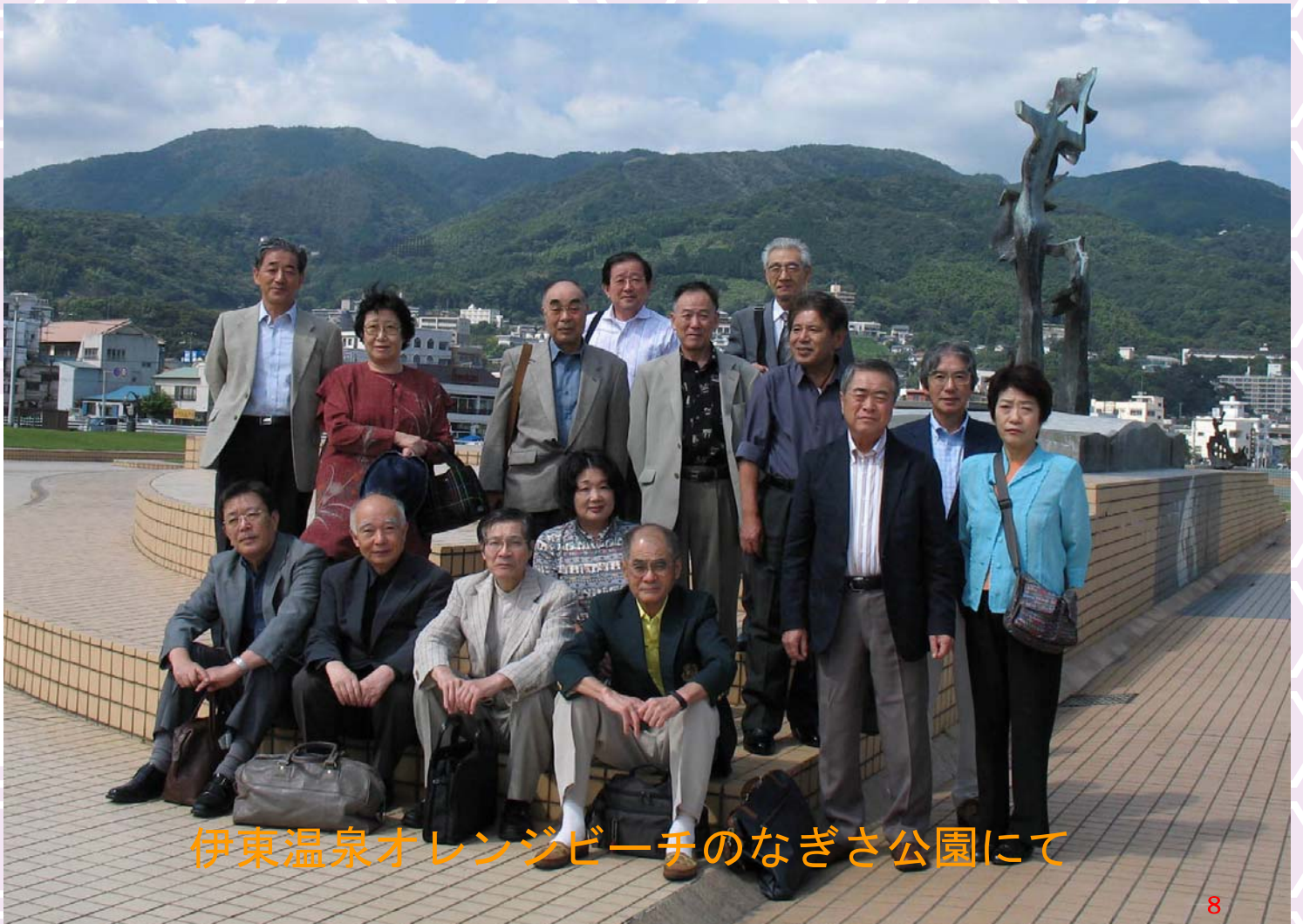
伊東温泉オレンジビーチのなぎさ公園にて