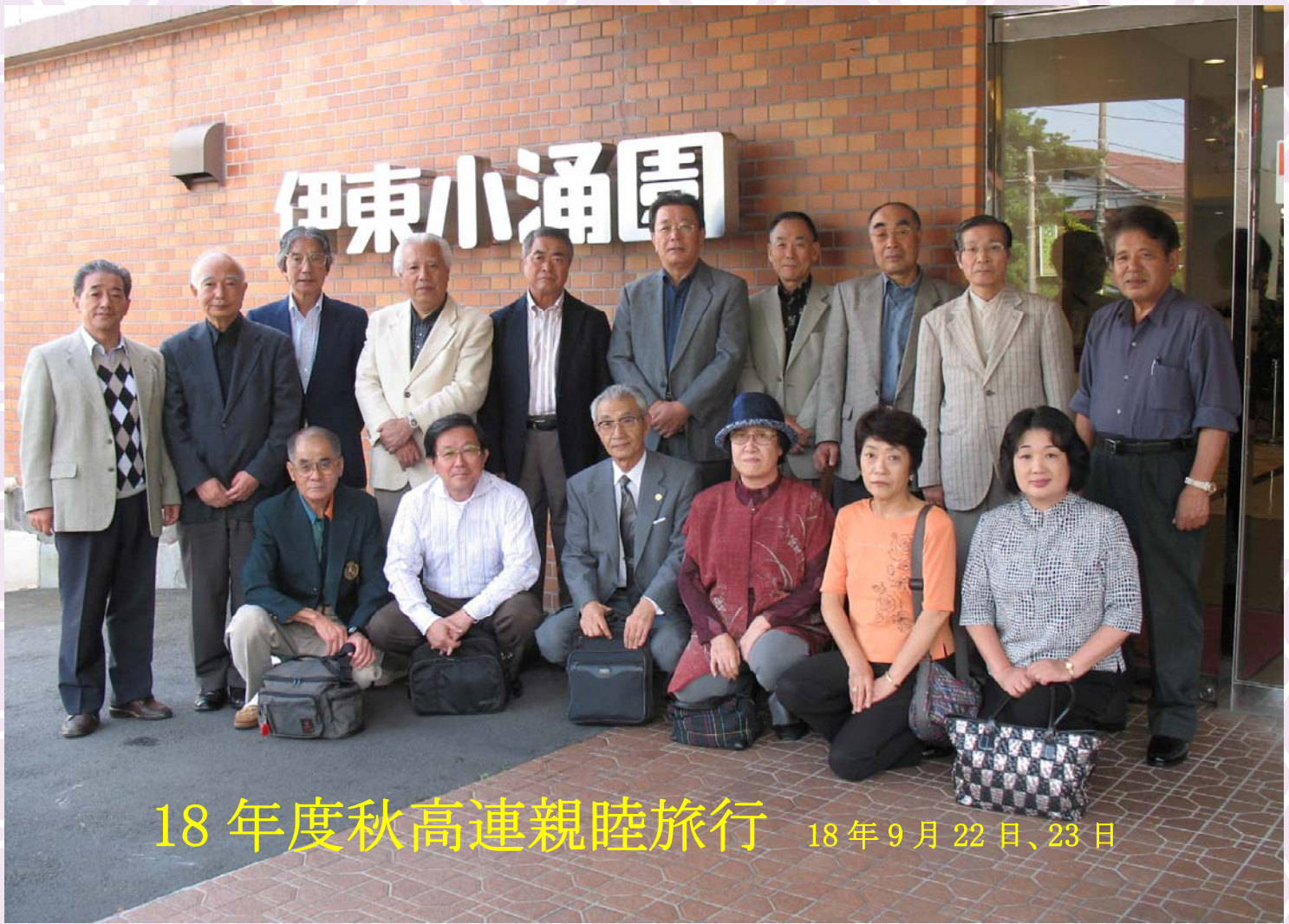
18 年度秋高連親睦旅行 18年9月22日、23日