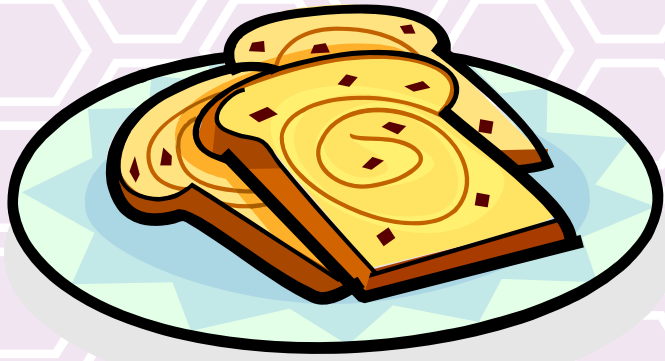
爽やかな気持ちでの朝食会