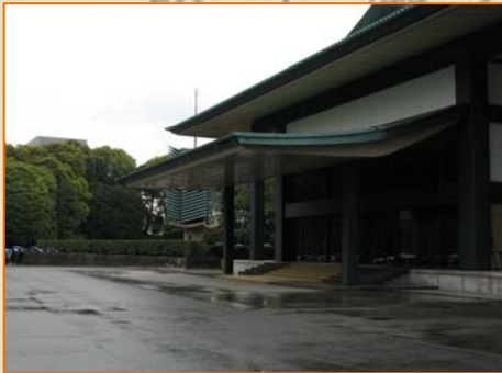
← 宮殿東、親任式撮影