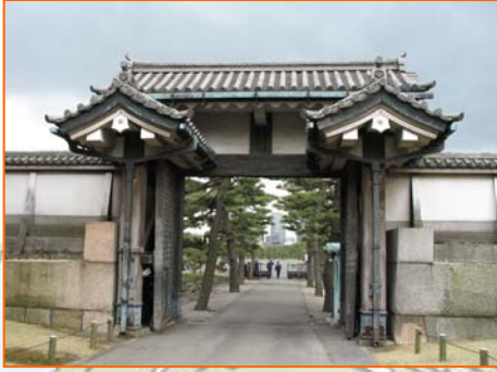
ス ← 桔梗門