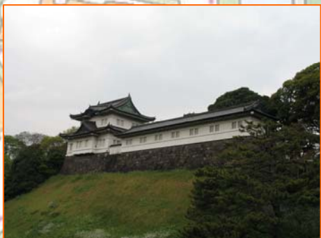
→ 宮殿東庭(一般参賀)